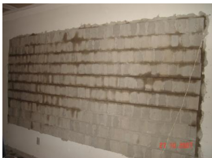
Figura 11. Foto do bloco tipo 1 assentado na fachada junto (interno)