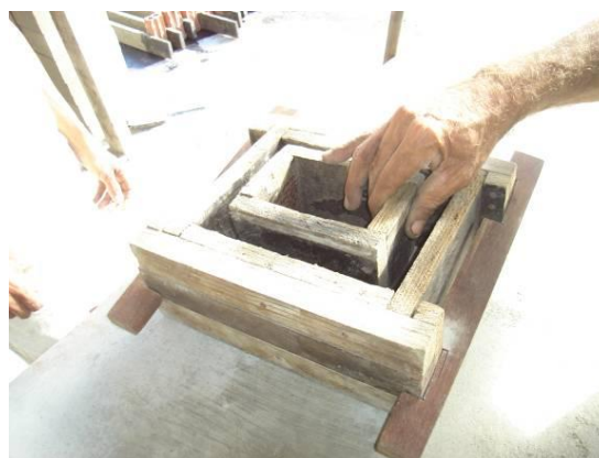
Figura 3. Foto da fôrma do elemento menor