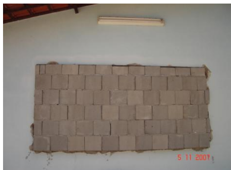
Figura 15. Foto do bloco tipo 2 assentado na fachada junto

O elemento tipo 2 (grande) fora testado em um segundo momento fechado, a fim de comparar seu desempenho de isolamento (Figuras 15 e 16). A medição foi realizada no dia 05/11/2007.