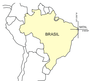
Figura 1. Mapa do Brasil com localização de Natal

O ecossistema objeto da investigação desta pesquisa está inserido na cidade de Natal, capital do Rio Grande do Norte, localizada no litoral oriental do estado, em região de baixa latitude. De acordo com Araújo; Martins; Araújo (1998), Natal caracteriza-se por um clima quente e úmido, e suas coordenadas (latitude 5o 45'54" Sul e longitude 35o 12'05" Oeste) definem sua posição intertropical, muito próxima à linha do equador (Figura 01). Dada sua localização geográfica, em Natal não há quatro estações marcadas, mas duas características épocas anuais com pequenas variações, uma de abril a setembro, e outra de outubro a março.