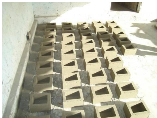
Figura 5. Foto da secagem do elemento menor