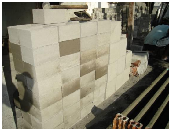
Figura 7. Foto da forma de empilhamento

No elemento vazado tipo 1 (menor) foram consideradas as dimensões: h (altura) = 0,14 m; c (comprimento) = 0,10 m; p (profundidade) = 0,19 m; e (espessura) = 0,02 m. No elemento vazado tipo 2 (maior) foram consideradas as dimensões: h (altura) = 0,25 m; c (comprimento) = 0,29 m; p (profundidade) = 0,25 m; e (espessura) = 0,03 m (Figura 8).