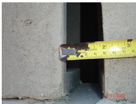
Figura 18. Foto do bloco tipo 2 assentado na fachada separado 5cm

A velocidade média externa dos ventos foi de 2,7 m/s no sentido sudeste. Observou-se que pela média aritmética simples dos valores de LAeq (dB) do W-SPL a diferença do nível de pressão sonora externo (83,0 dB) para interno (50,0 dB) foi de 33,0 dB, portanto mais isolante do que o cobogó tipo 1 (pequeno aberto).