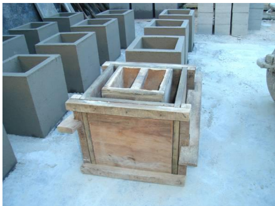
Figura 4. Foto da fôrma do elemento maior