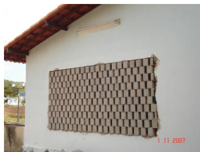
Figura 14. Foto do bloco tipo 1 assentado na fachada separado 5cm

O elemento tipo 2 (grande) fora testado em um segundo momento fechado, a fim de comparar seu desempenho de isolamento (Figuras 15 e 16). A medição foi realizada no dia 05/11/2007.