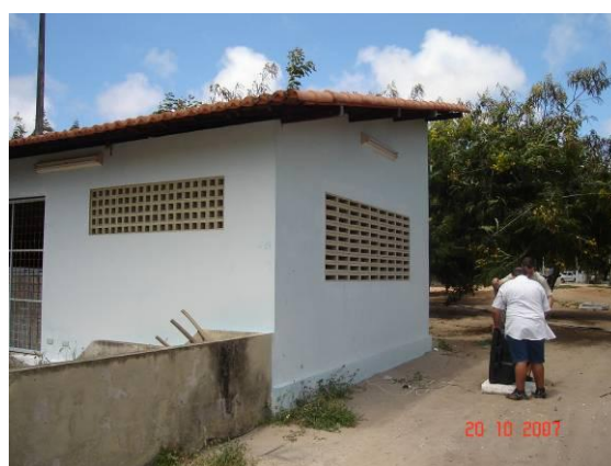
Figura 10. Fotos da sala internamente (visual 1) e externamente (visual 2)

O princípio da medição do tempo de reverberação é realizado a partir da Resposta Impulsiva (RI), que é viabilizada com o uso do software Aurora , desenvolvido pelo prof. Angelo Farina (Itália). A obtenção da Resposta Impulsiva (RI) foi realizada a partir de um sinal de 1 minuto, o Multi MLS Signal emitido pelo próprio programa de medição. A fonte sonora foi posicionada no centro da sala e a captação do sinal foi feita no centro da sala.