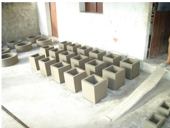
Figura 6. Foto da secagem do elemento maior