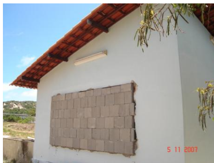
Figura 16. Foto do bloco tipo 2 assentado na fachada junto