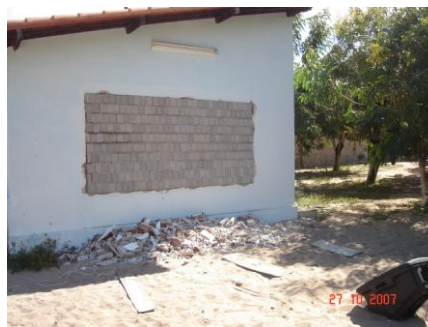
Figura 12. Foto do bloco tipo 1 assentado na fachada na fachada junto

O elemento tipo 1 (pequeno) fora testado em um segundo momento aberto com 5 cm de espaçamento entre eles, a fim de comparar seu desempenho de isolamento (Figuras 13 e 14), medição realizada 01/11/2007. A velocidade média externa dos ventos foi de 3,5 m/s no sentido sudeste. Observou-se que pela média aritmética simples dos valores de LAeq (dB) do W-SPL a diferença do nível de pressão sonora externo (85,8 dB) para interno (77,8 dB) foi de 8 dB, portanto menos isolante do que o cobogó anteriormente existente na edificação, apesar de pouca diferença e de critério de avaliação de acordo com os cálculos estabelecidos pela norma, que usam o Tempo de Reverberação da sala receptora na fórmula para estabelecer o isolamento real. Os níveis de iluminação apresentaram dados muito baixos, entre 39 e 115 lux, tendo em vista a área aberta de apenas 26%.