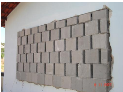
Figura 17. Foto do bloco tipo 2 assentado na fachada separado 5cm

O elemento tipo 2 (grande) fora testado em um segundo momento aberto com 5 cm de espaçamento entre eles, a fim de comparar seu desempenho de isolamento (Figuras 17 e 18). A medição foi realizada no dia 06/11/2007.