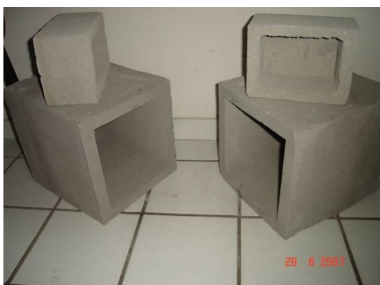
Figura 2. Foto dos elementos tipo 1 (menor) e 2 (maior)

Tendo em vista o fator também preponderante nesta pesquisa de desenvolver um bloco mantenha sua conotação popular e, portanto, como custos baixos, inclusive porque os únicos componentes no mercado que permitem a passagem da ventilação e isolam o ruído, como os atenuadores e as venezianas acústicas, possuem preços muito elevados, procurou-se utilizar fôrmas já existentes que pudessem ser adaptadas para o objetivo do bloco a ser estudado. Foram identificadas duas dimensões de blocos para adaptação. A primeira menor (elemento vazado tipo 1) foi adaptada de um bloco de cimento utilizado para montagem de alvenaria comum de vedação. O maior (elemento vazado tipo 2) foi adaptado de um bloco de cimento utilizado como caixa de gordura, sendo esta seccionada para se adaptar a geometria desejada (Figuras 2 a 7). A confecção é realizada de uma forma bem artesanal, não sendo necessária uma produção em usina.