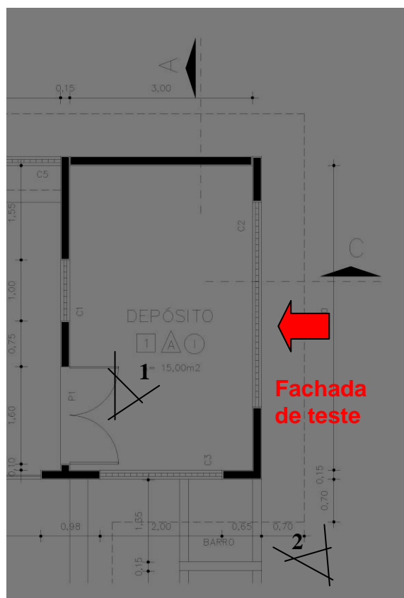
Figura 9. Planta da sala de teste com detalhe para a fachada onde serão aplicados os elementos vazados