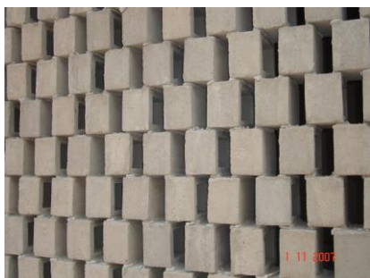
Figura 13. Foto do bloco tipo 1 assentado na fachada separado 5cm

O elemento tipo 1 (pequeno) fora testado em um segundo momento aberto com 5 cm de espaçamento entre eles, a fim de comparar seu desempenho de isolamento (Figuras 13 e 14), medição realizada 01/11/2007. A velocidade média externa dos ventos foi de 3,5 m/s no sentido sudeste. Observou-se que pela média aritmética simples dos valores de LAeq (dB) do W-SPL a diferença do nível de pressão sonora externo (85,8 dB) para interno (77,8 dB) foi de 8 dB, portanto menos isolante do que o cobogó anteriormente existente na edificação, apesar de pouca diferença e de critério de avaliação de acordo com os cálculos estabelecidos pela norma, que usam o Tempo de Reverberação da sala receptora na fórmula para estabelecer o isolamento real. Os níveis de iluminação apresentaram dados muito baixos, entre 39 e 115 lux, tendo em vista a área aberta de apenas 26%.